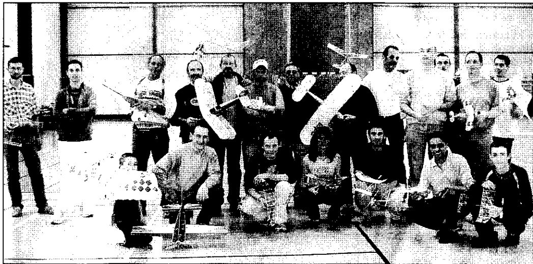
Le concours régional de vol libre et les démonstrations de vols radio-commandés, qui ont eu lieu au gymnase du Tourrier, ont rassemblé de nombreux amateurs.