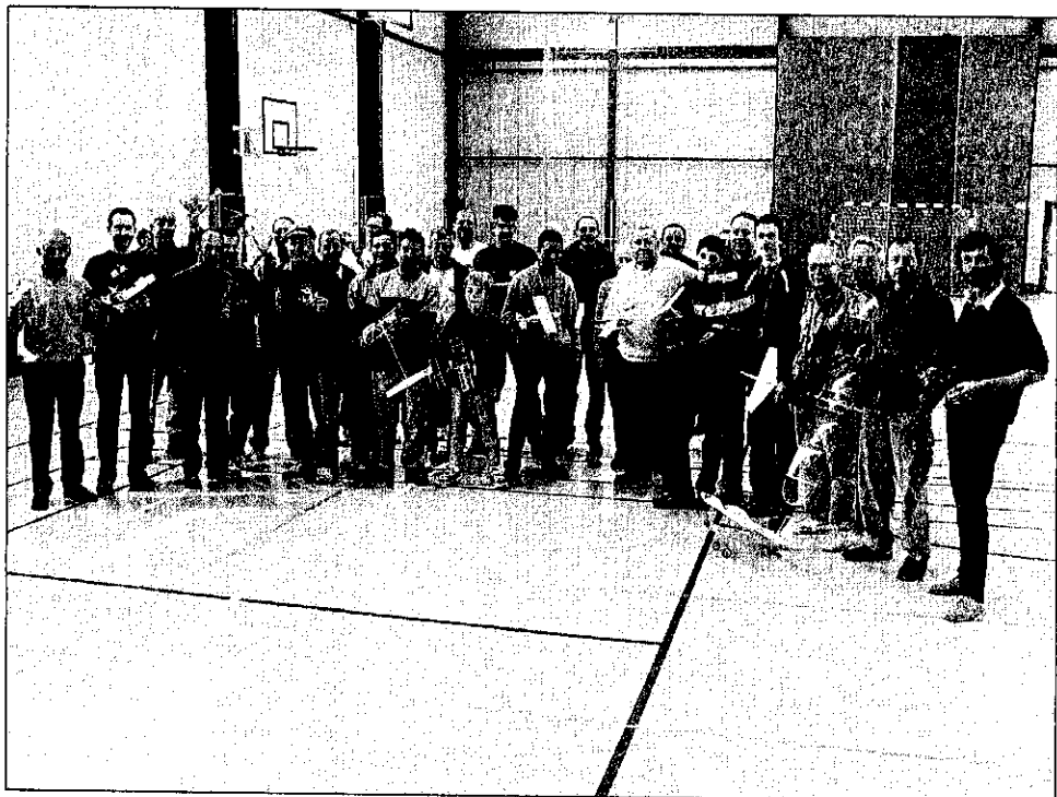
C'est au gymnase du Tourrier que les passionnés de vol d'intérieur se sont retrouvés pour confronter leurs modèles et leur savoir faire.

Certains parvenant à faire voler leur avion jusqu'à dix minutes. On trouve aussi pour les passionnés des avions bon marché (surtout si le moteur est en caoutchouc), des maquettes de dimensions manipulables et faciles à stocker et enfin la très