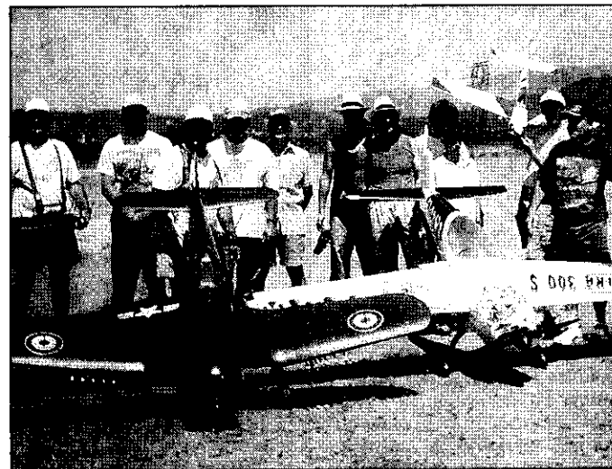
C'est sur le site de Villelaure, que le club "Epervier du sud-Luberon" a organisé sa fête de fin d'année.