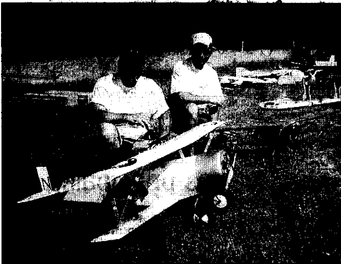
Les pilotes ont présenté des aéronefs de toute beauté, réalisés par leurs soins.

M Club de Cheval Blanc, MAC de l'Hérault et bien sûr les pilotes du club local. Tous étaient là pour présenter un spectacle aérien de grande qualité. Spectacle seulement perturbé par quelques pertes de contrôle du fait de la chaleur intense qui entraîne la modification du comportement en vol des aéromodèles.