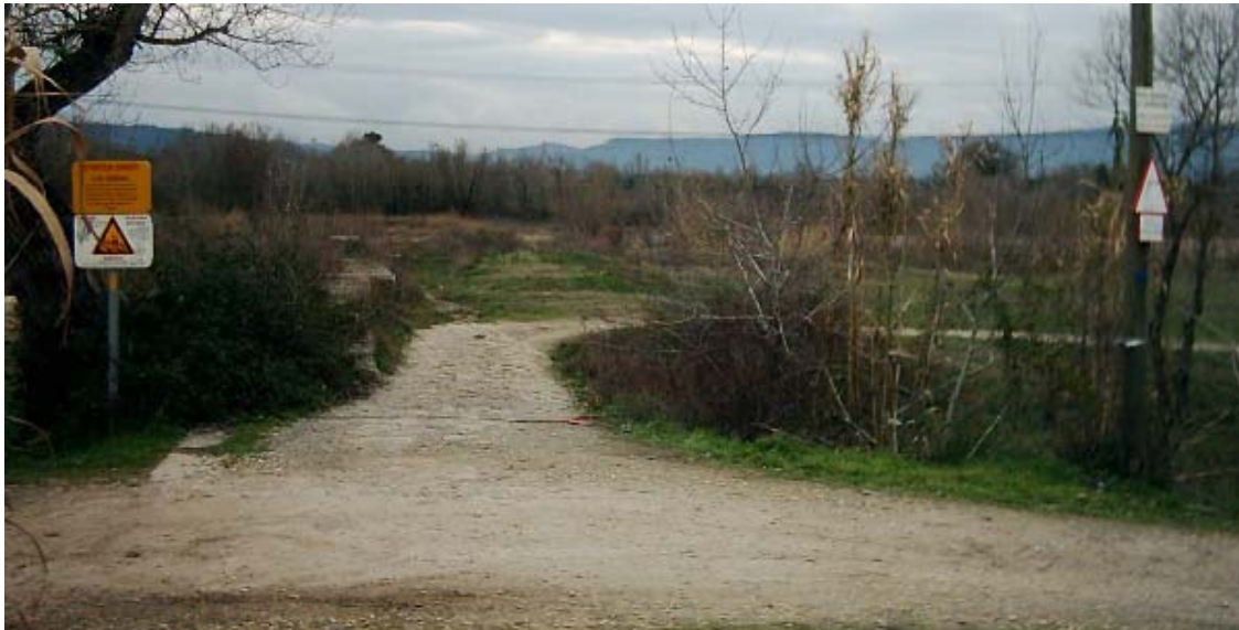
Emplacement souhaité pour les blocs de pierre ou une barrière