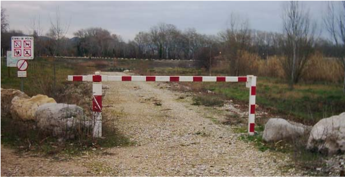
Exemple de barrière souhaitée (photo prise à l'entrée de l'étang de pêche du Farigoulier)