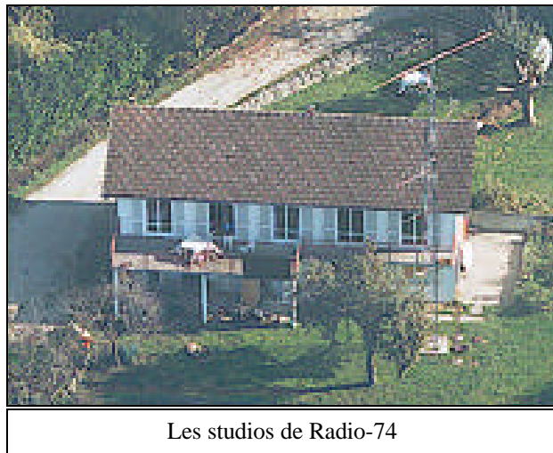
Les studios de Radio-74