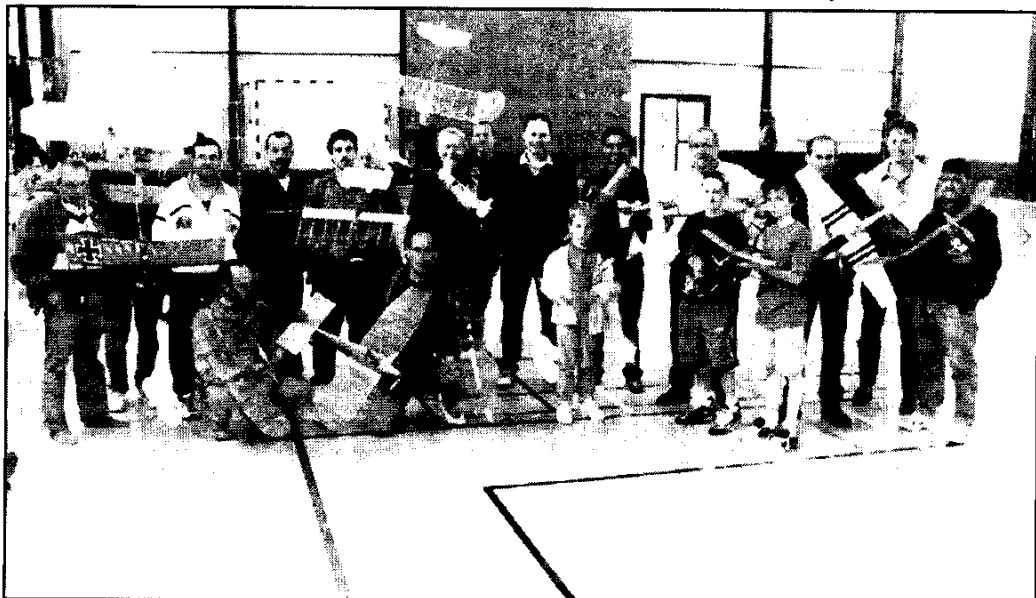
Cette manifestation, la quatrième du nom a permis de voir évoluer des avions surprenants dont le poids allait du demi-gramme à 200 grammes.

Comme ces avions sont très légers, leurs évolutions se sont déroulées à l'abri du vent, à l'intérieur du gymnase. D'où le nom de vol Indoor.